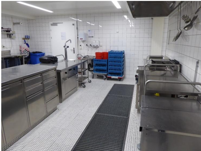
Küche im ursprünglichen Zustand