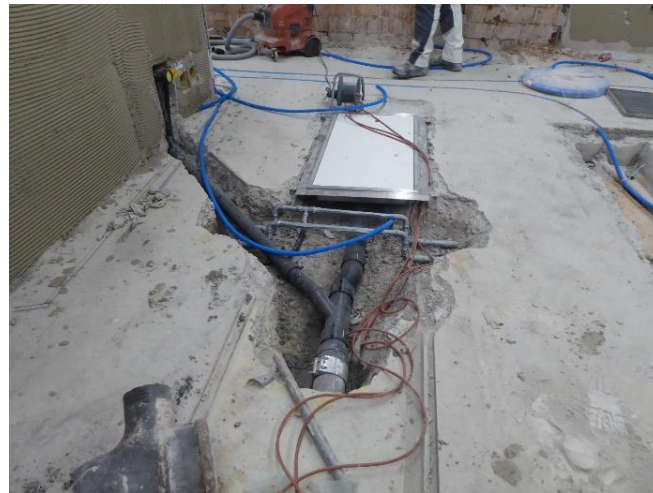
Erneuerung der Kanalisationsleitung – Eingriff bis auf „Mark und Bein“

Konzept: Vorgabe war, dass sämtliche Geräte und Einrichtungen, welche noch funktionstauglich sind, vorsichtig ausgebaut und wieder verwendet werden. Das vorhandene Warenlager, die Kühlzelle sowie der Tiefkühlschrank konnten ebenfalls belassen werden. Die Arbeitsplätze wurden optimiert, damit die Wege kürzer werden (Anlieferung, Rüsten, Kochen, Essenausgabe und Abwaschen). Aus hygienischen Gründen und von der Arbeitssicherheit her wurde ein fugenloser, rutschfester Bodenbelag eingebaut.