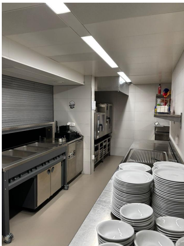
Küche nach Sanierungsarbeiten